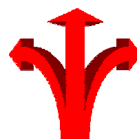
Illustrazione delle fonti informative a cui far riferimento per la realizzazione del

Incontro, a cura del Settore Politiche del Lavoro, Politiche Giovanili e Sanità, Servizio Politiche Giovanili ed Informagiovani, della Provincia di Benevento, in aula con gli studenti per formare/informare sulle caratteristiche del mercato del lavoro e sulle competenze necessarie per entrare nel mondo del lavoro (flessibilità, lavoro in gruppo, problem solving, creatività, capacità organizzative, conoscenza delle lingue straniere).